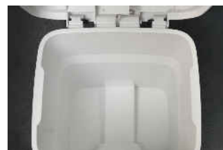
Trittmechanik optimal verbaut

Der Deckel schließt langsam und geräuschlos. Dies ist mittels einer Stellschraube regulierbar.